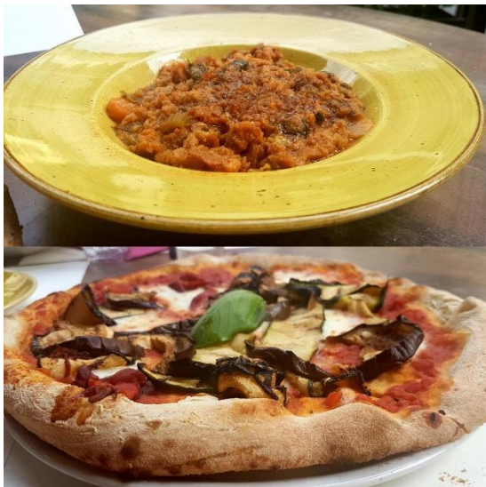
Slika 4: Ribollita contadina della tradizione toscana