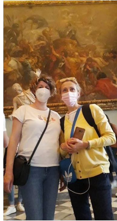
Slika 6: Razgledanje umetničkih dela