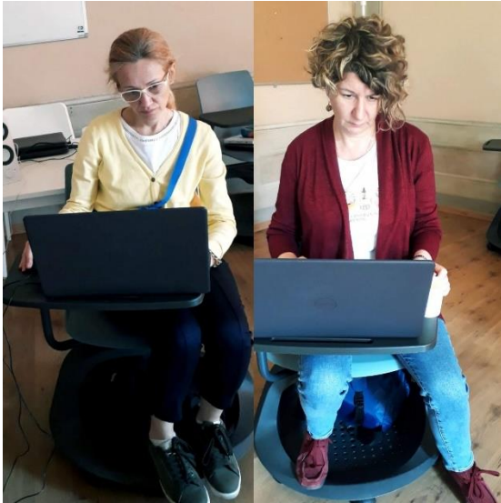
Slika 3: Primena naučenog kroz kreiranje novih lekcija u Quizizz-u