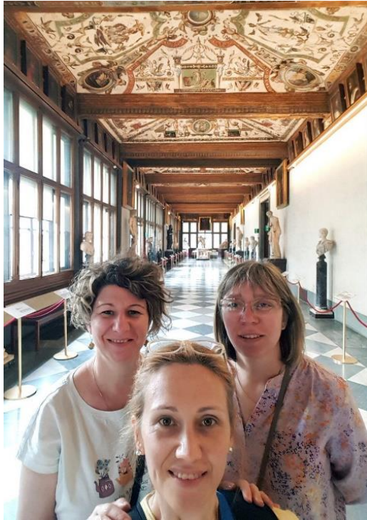
Slika 5: U hodniku Galerije Ufici