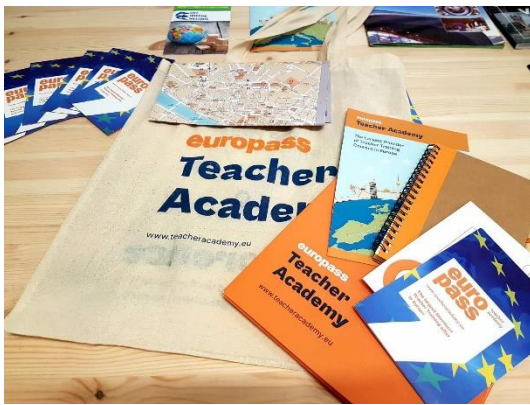
Slika 1: Materijal za sve učesnike

Danas smo na novoj lokaciji, nešto bliže reci Arno.