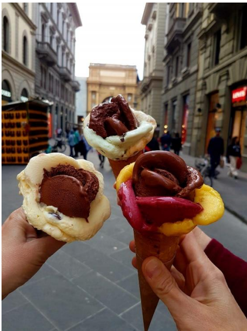
Slika 7: Sladoled za kraj dana